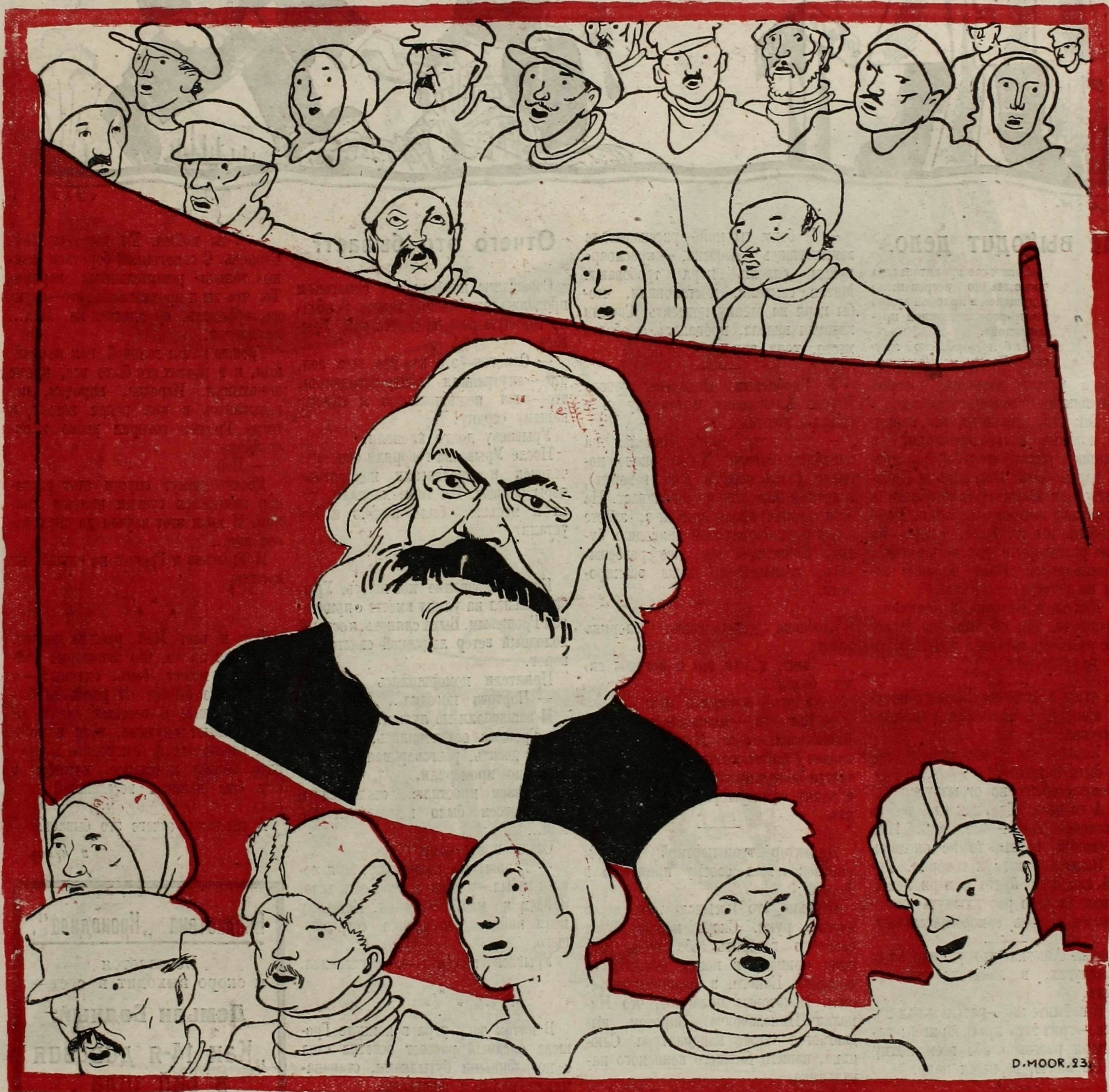
Рис. Д. Моора.