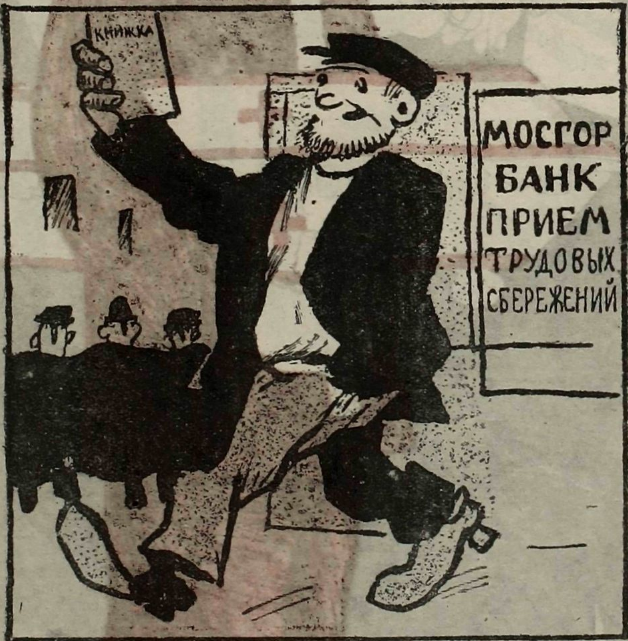
3. Ну, а Пров иного мненья, И нашел он путь такой: Трудовые сбереженья В банк вложил он городской.