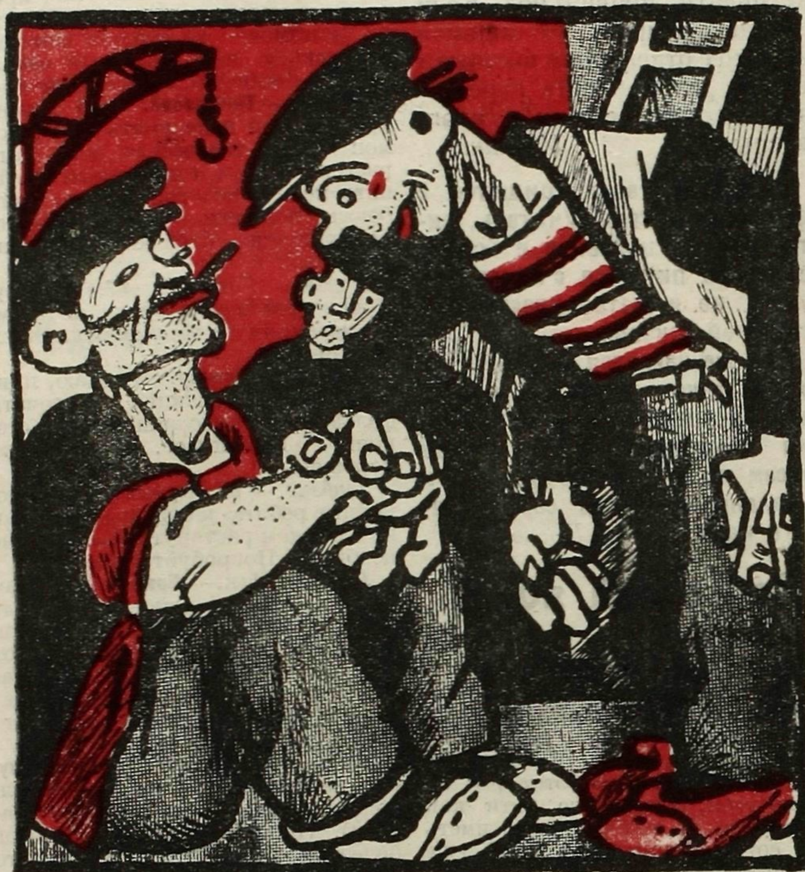
Рис. Ив. Малютина.

— «Почитал-бы «Крокодила», Но достать журнальчик—где?» — «Не смотри на мир уныло: Помогу твоей беде!»