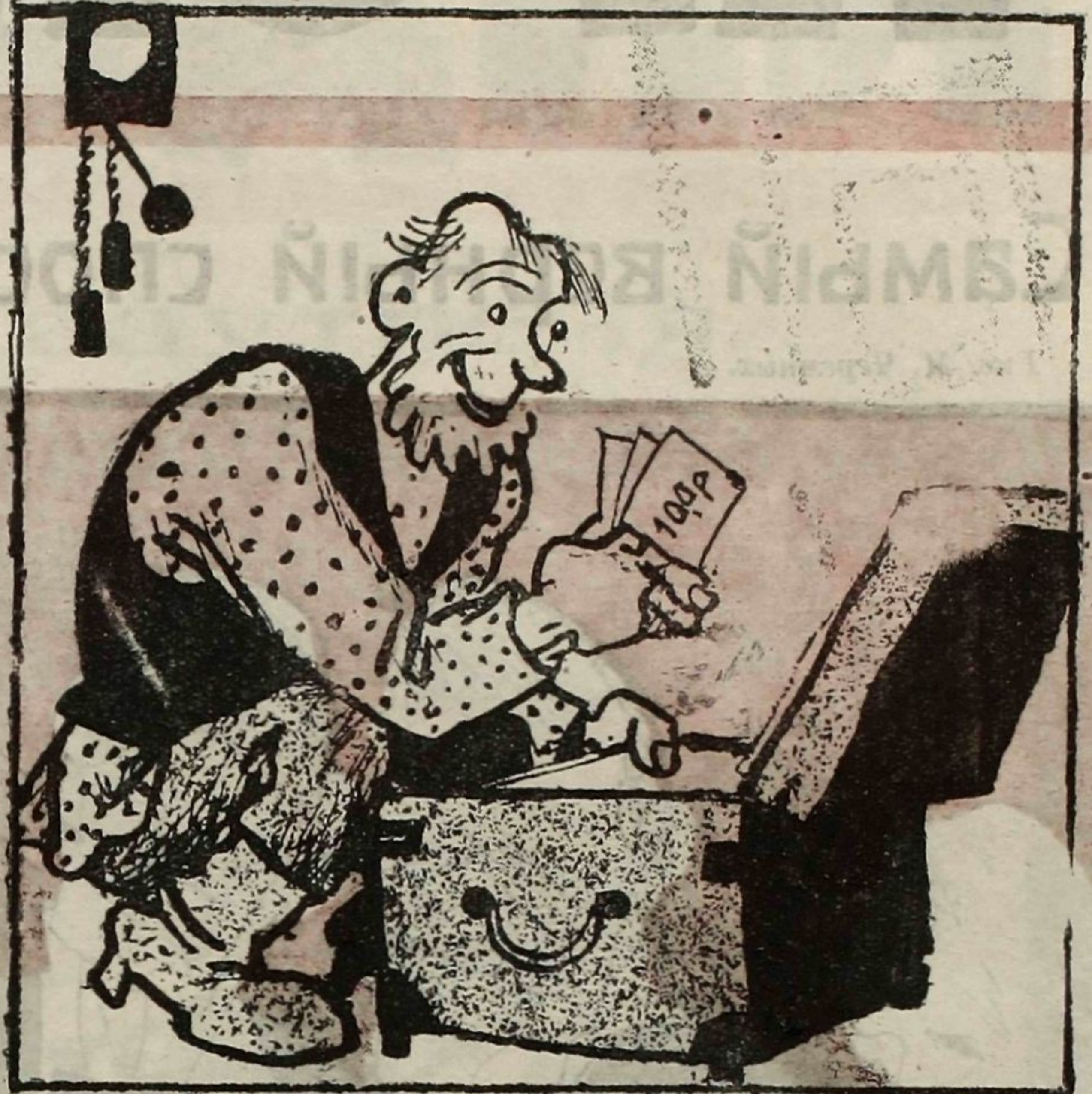
2. Дома после разговора, Заперевши дверь на ирюн, Сидор спрятал очень скоро Деньги в кованный сундук.