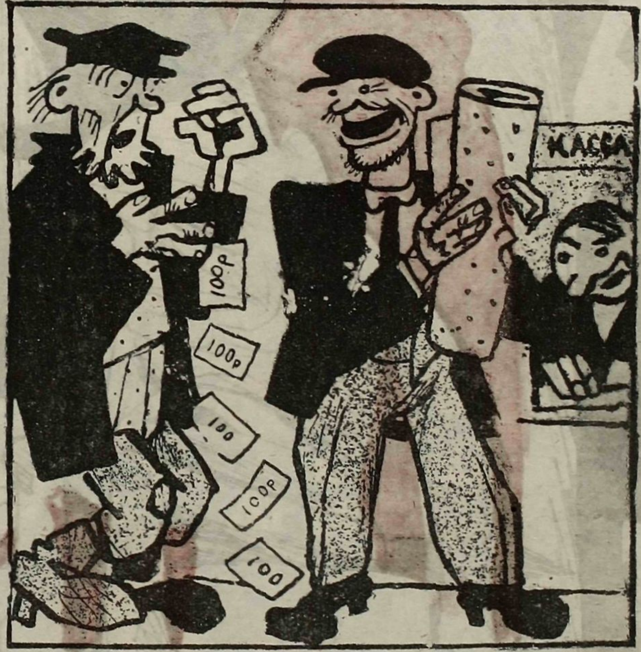
4. Результат: с отрезом ситца Пров сият, как луна. Сидор может лишь коситься: Не по денежкам цена!

3. Деньги вровень получали. Ну, так в чем разгадка тут? — В СУНДУКЕ ОНИ — УПАЛИ, В БАНКЕ-Ж ДЕНЕЖКИ — РАСТУТ!