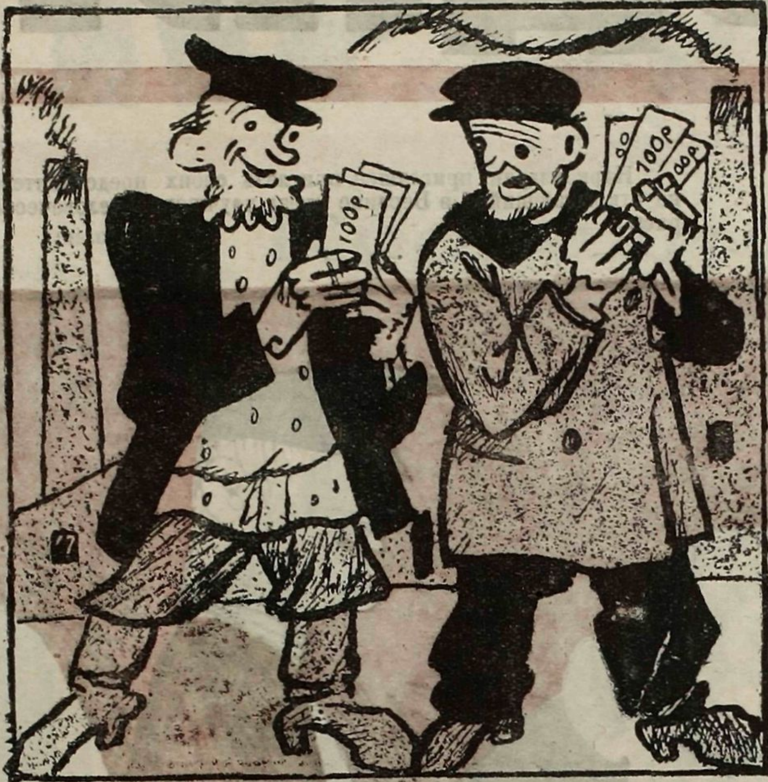
1. Сидор с Провом в день полунки Завели такую речь: — «Мам бы денежки получше До весны нам уберечь?»