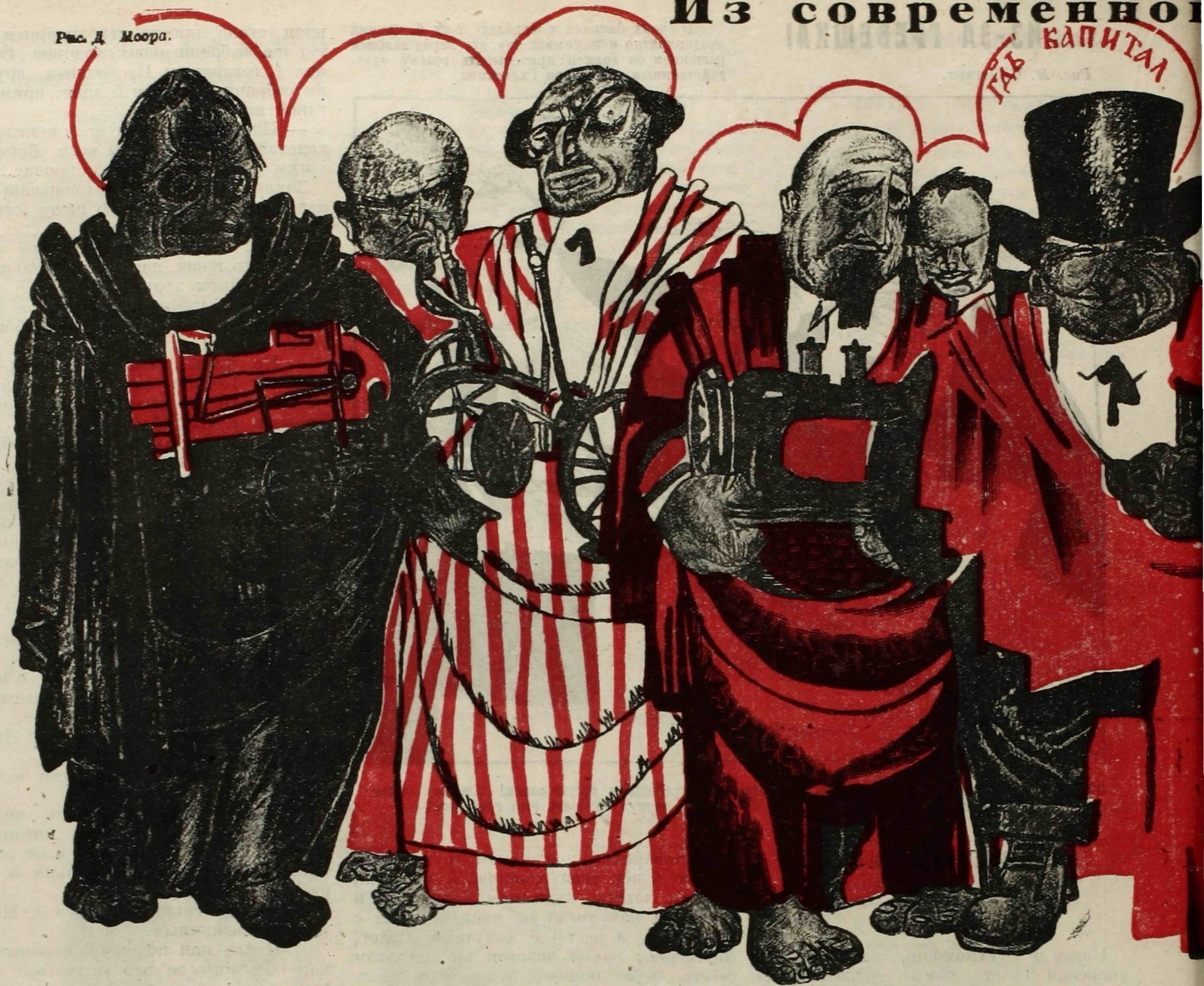
Господь Капитал (апостолам): — Шедше, проповедуйте всем языком, что без советской России И скажите еще, что я извещаю об этом родных и знакомых в глубь