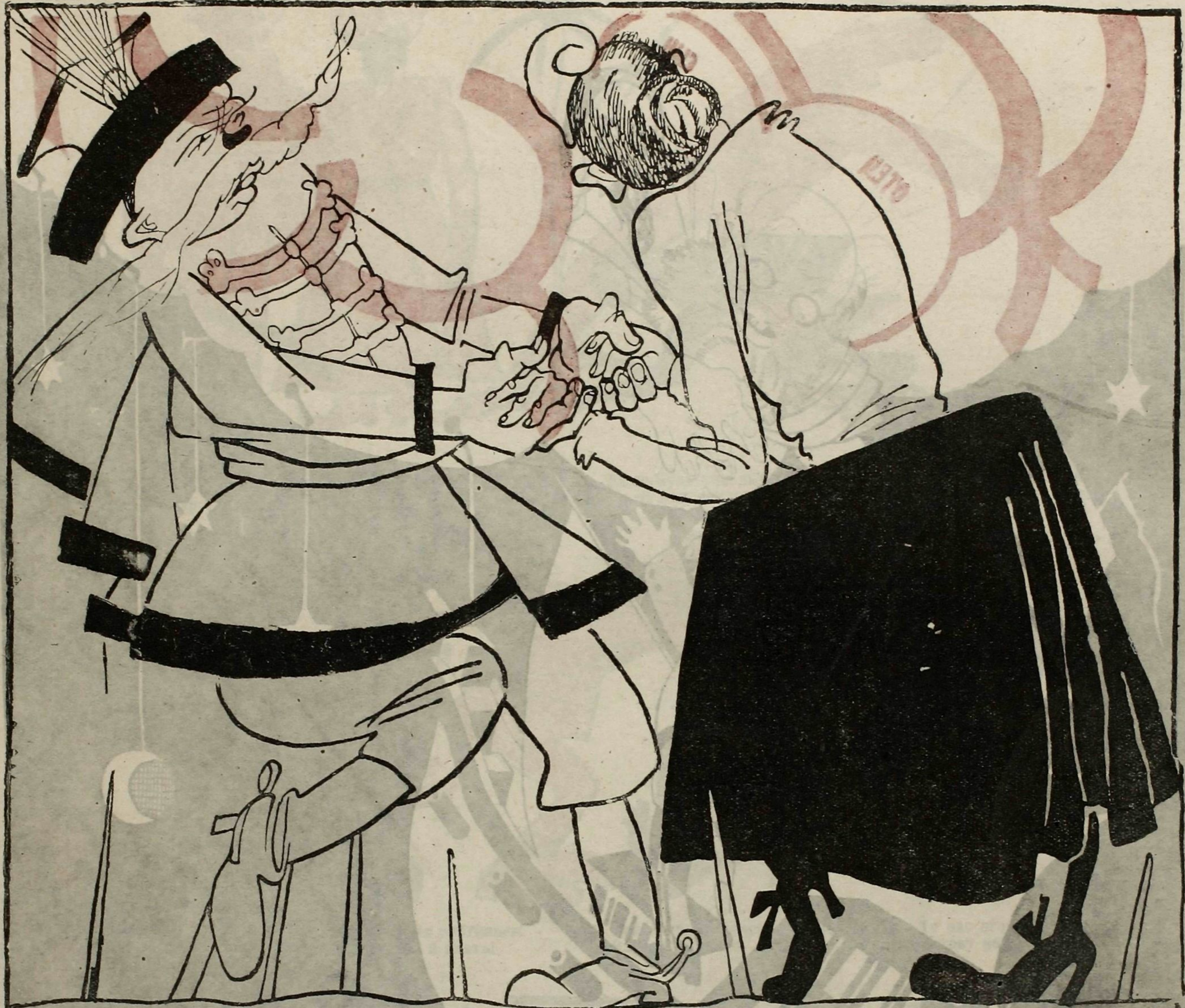
Рис. Д. Моора.

Политические процессы в Польше и жестокие приговоры коммунистам действуют только в одном смысле: они укрепляют и усиливают подпольную работу революционеров. Из зарубежных газет.